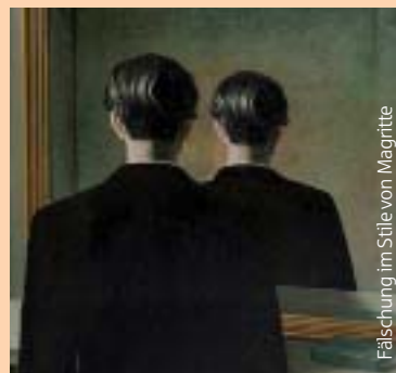
Fälschung im Stile von Magritte