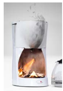
Brandursachen 2002 – 2017